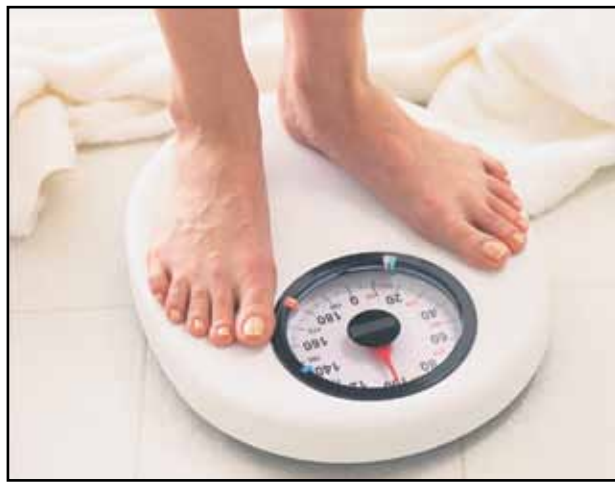
Läskillä lukutaitoa -kampanjaan saavat osallistua kaikki Suomessa asuvat täysikäiset henkilöt, joilla on ylipainoa.

Suomalainen yksityishenkilö on haastanut suomalaiset, Suomen evankelis-luterilaiset seurakunnat ja Terveiden ja hyvinvoinnin laitoksen (THL) mukaan laihdutus- ja kampanjaan. Yksityishenkilön maksama kampanjan laihdutus- ja kampanjan mukana määrätty tukisumma käytetään Nepaliläisopettajankoulutuksen hyväksi. Ostotarjous on tehty maksimissaan 10 miljoonalla eurolla.