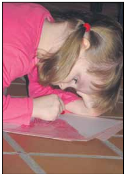
Anni uppoutuu piirtämiseen.

Tulimme Lastenkirkkoon vähän jännittyneinä. Mutta jännittyneitä olivat myös strutsi ja gorilla , jotka tervehtivät pieniä kirkkovieraita, ja miettivät, miltä heistä tuntuu. Ihastuneelta, surulliselta, pelokkaalta, iloiselta. Tunteet saimme piirtää Linnantauksen kirkkosalin lattialla, ja piirustukset kerättiin alttarikaiteelle kaikkien nähtäväksi.