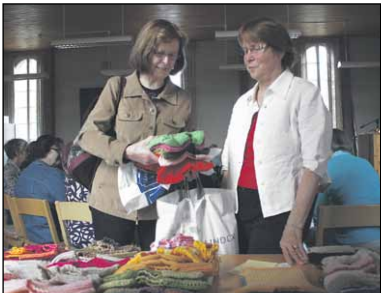
Nutut lähetetään kesäkuun puolessa välissä Etiopiaan, johon asti nuttupinoja voi käydä ihmettelemässä Kansanlähetykskodilla.

Kajaanin nuttupiiri lähettää tänä keväänä 287 nuttua, 129 sukkaparia ja 50 myssyä Etiopian Black Lions-sairaalaan Addis Abebaan. Lähetykseen sisältyy myös Puolangalta tulleet 47 nuttua, 42 sukkaparia ja 39 myssyä.