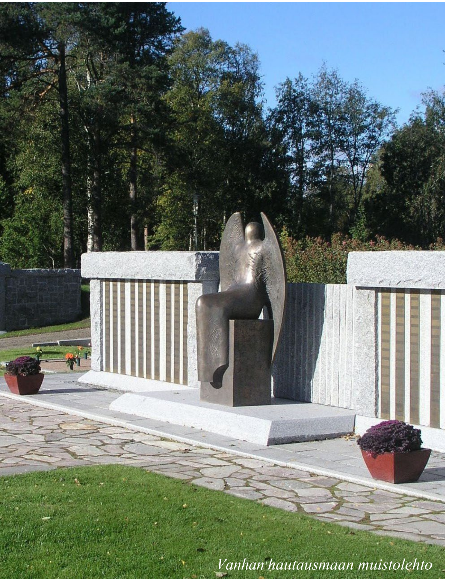
Vanhan hautausmaan muistolehto